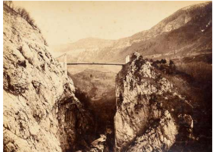
Pont suspendu de l'Abîme (Haute-Savoie) construit entre 1887 et 1891. 46 S, fonds Arnodin – Leinekugel Le Cocq, Archives de Brive.