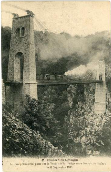
Passage du Tacot sur le Viaduc des Rochers Noirs (Corrèze) inauguré en 1913. 46 S, fonds Arnodin – Leinekugel Le Cocq, Archives de Brive.