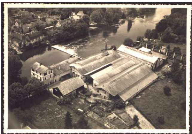
Vue aérienne de l'usine au bord de la Vézère, sans date. 46 S, fonds Arnodin – Leinekugel Le Cocq, Archives de Brive.