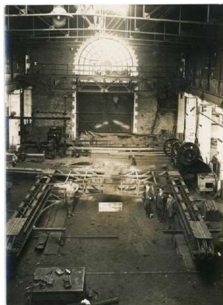
L'intérieur de l'usine de Larche vers 1928, lors de la construction du pont de Saint-Jean-de-Blaignac (Gironde). 46 S, fonds Arnodin – Leinekugel Le Cocq, Archives de Brive.