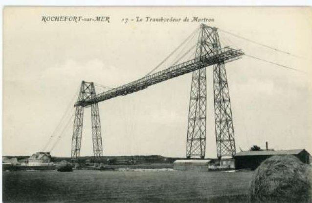
Vue sur le pont transbordeur de Rochefort (Charente-Maritime) inauguré en 1900. 46 S, fonds Arnodin – Leinekugel Le Cocq,