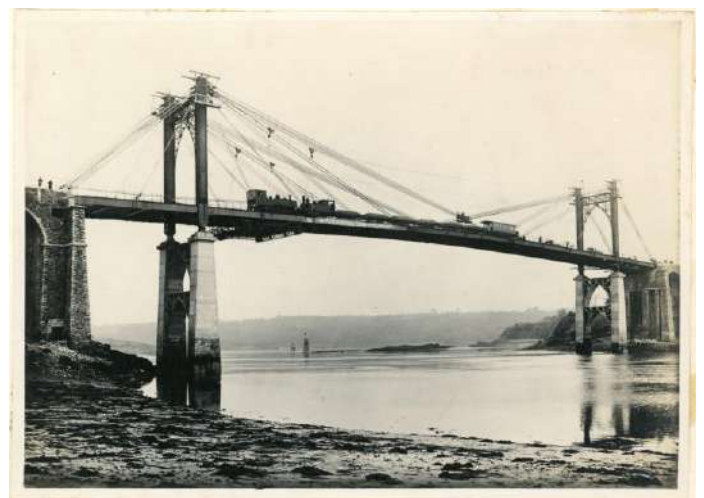
Pont suspendu de Lézardrieux (Côtes-d'Armor) reconstruit en 1924. 46 S, fonds Arnodin – Leinekugel Le Cocq, Archives de Brive.