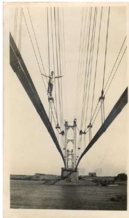
Un ouvrier équilibriste sur le pont de Deir ez-Zor (Syrie) en cours de construction, 1925-1931.