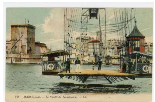
La nacelle du pont transbordeur de Marseille (Bouches-du-Rhône) construit entre 1903 et 1905. 46 S, fonds Arnodin – Leinekugel Le Cocq, Archives de Brive.